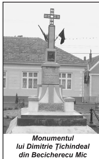
Monumentul lui Dimitrie Țichindeal din Becicherecu Mic