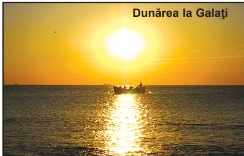
Dunărea la Galați